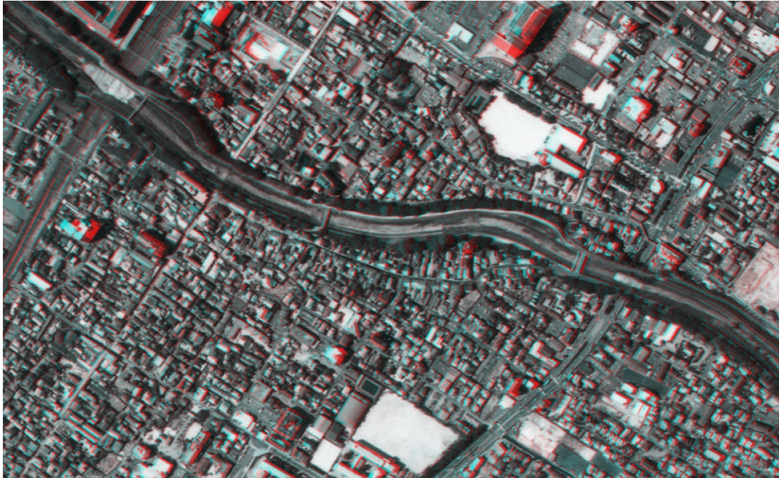
空中写真（アナグリフ） 国土地理院 KK-2003-1X C14-19, 20（2003年撮影）からアナグリフ作成

掲載した空中写真および地図は、国土地理院長の承認を得て、同院撮影の空中写真および同院発行の2万5千分の1地形図を複製したものである。（承認番号 平17総複、第392号）