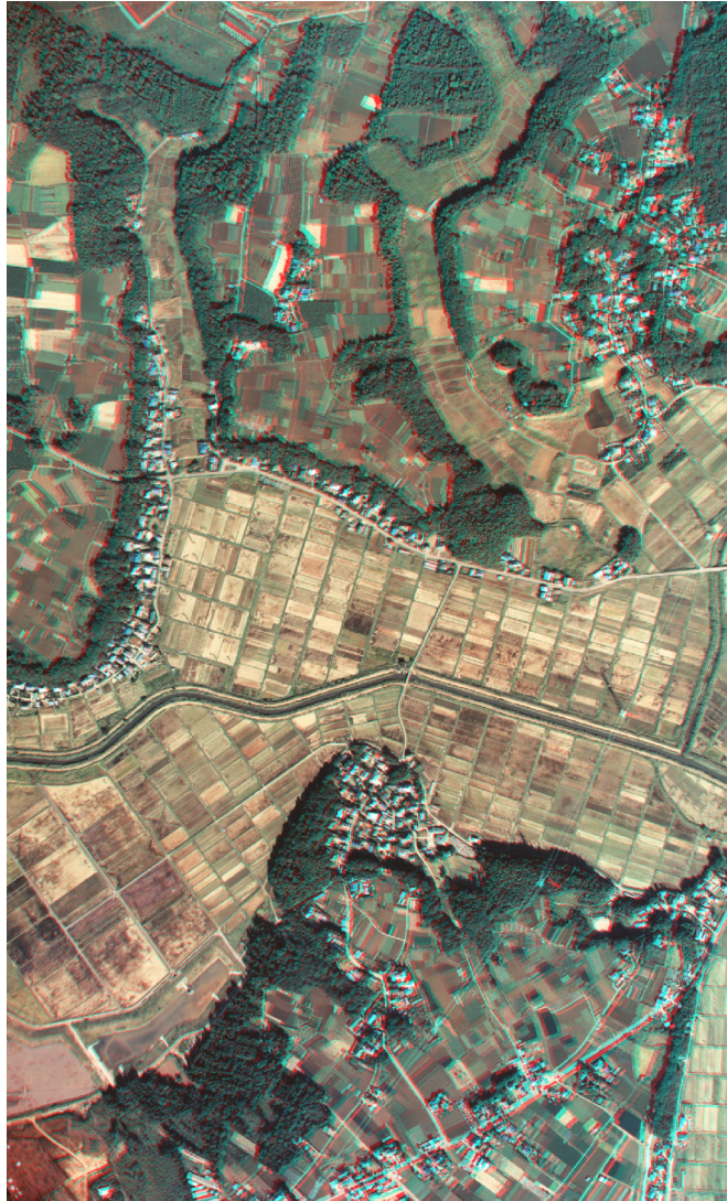
空中写真（アナグリフ）

国土地理院 CKT-89-4 C10-14, 15（1989年撮影）からアナグリフ作成