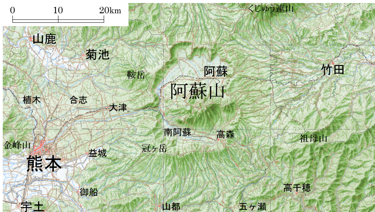
地勢図 国土地理院 1:200000地勢図から地名等を除去し 1:500000に縮小したうえで加筆したもの